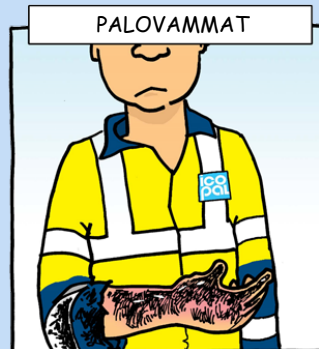
Jäähdytä vedellä. ÄLÄ yritä poistaa bitumia iholta itse.