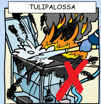
ÄLÄ koskaan käytä vesisuihkua bitumipaloon