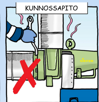
ÄLÄ työskentele kuumien laitteiden lähellä.